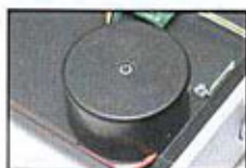
解碼器所使用的環形牛