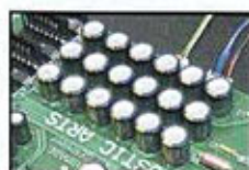
解碼器上足料的濾波電解電容