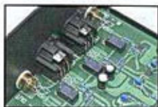
平衡式 XLR 輸出